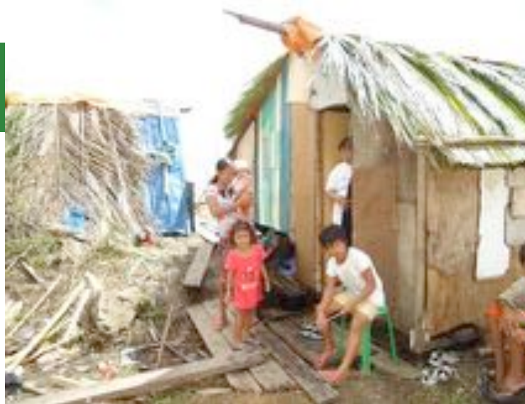
Hinterlassenschaften des Taifuns: Eine Familie aus Quinapondan vor den Trümmern ihrer Existenz

Die Zusammenarbeit mündete schließlich im August 2014 in der Gründung des „Waray Empowerment Network Germany Philippines e.V.“ Zuvor konnten wir dankenswerterweise verschiedene Projekte in der Region über die Strukturen des Freies Wort hilft e. V. realisieren, der regelmäßig insbesondere nach Naturkatastrophen Soforthilfemaßnahmen unterstützt.